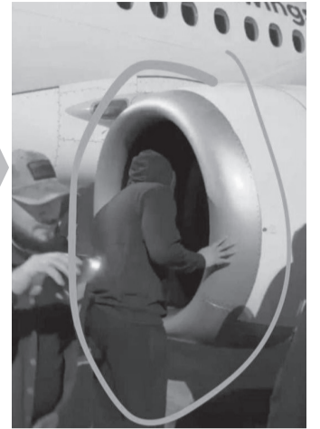
Молодой дагестанец ищет «еврейцев». Аэропорт в Махачкале, 29 октября 2023 г.

ной к истерикам, категоричным суждениям и выяснению отношений.